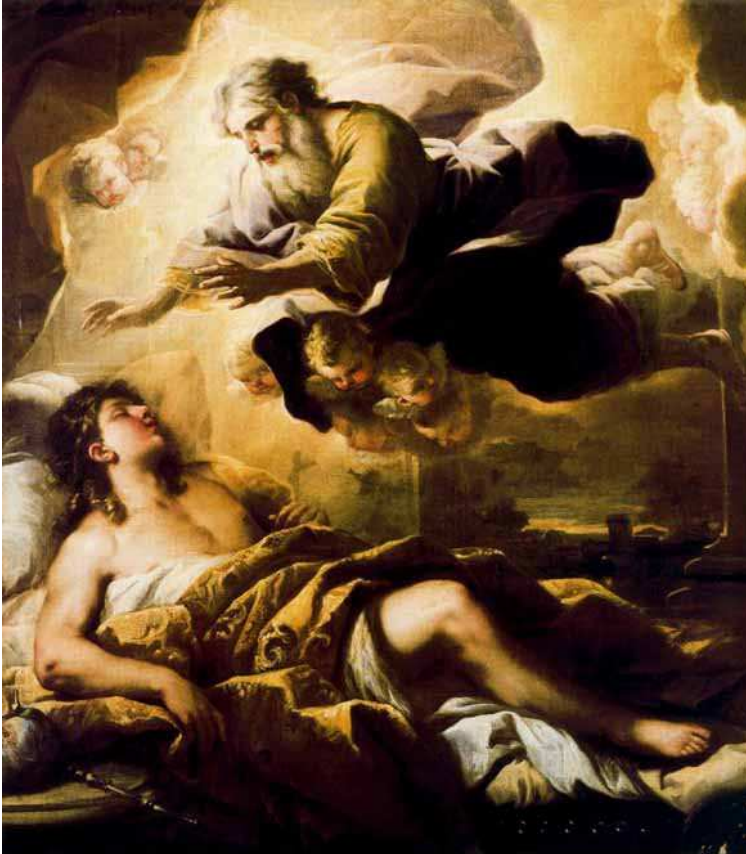
Luca Giordano, Re Salomone riceve il dono della saggezza, Collezione privata

La parola che ci viene consegnata, oggi, è molto intensa. Soltanto un accenno alla prima lettura, che riguarda il sogno. Salomone va al santuario di Gabaon e semina un sogno.